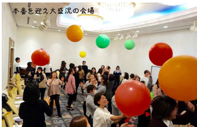
本番を迎え大盛況の会場

他園の保育や価値観と出会うことで、自分や自園の保育を振り返るきっかけにもなります。