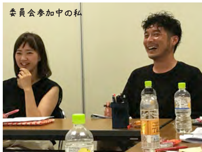
委員会参加中の私

研修を企画するところから始まります。「こんな研修があったらいいな」「こ~うのやってみたいな」を出し合っていきます。